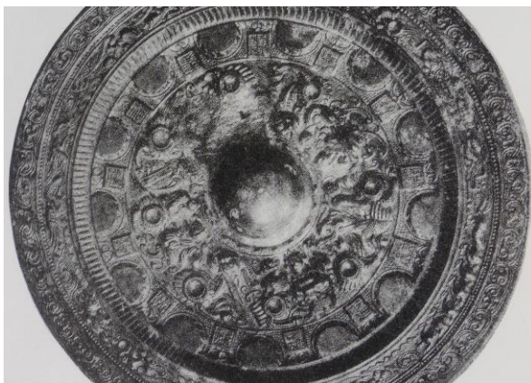
図 12 唐草流雲繫文鏡 径 13.1 cm

したがって、本鏡は南斉明帝建武 5 年（498）でなく、後趙石虎建武 5（339）年を妥当な年代とすべきである。