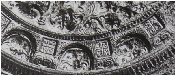
図4 建武五年鏡（拡大図）

吾作明鏡 王吉□□ 亙□昌万 □周家東（5枚不明）太□宋国 五年建武 冊命晋侯（1枚不明）其師命長（図4）