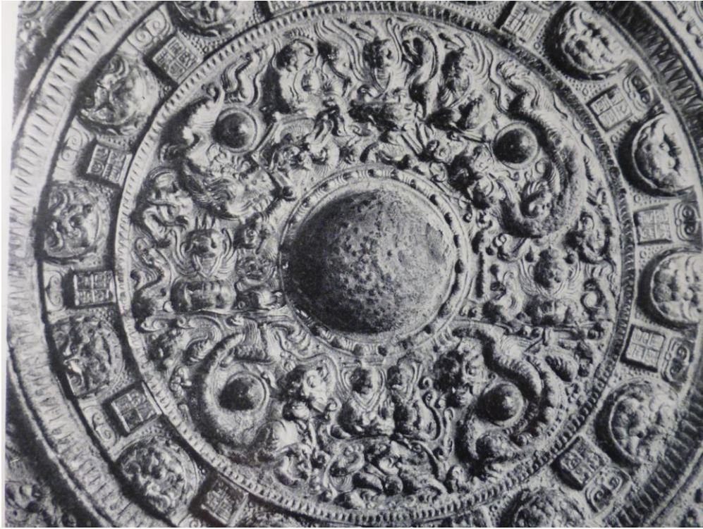
図5 建武五年鏡（内区画像）