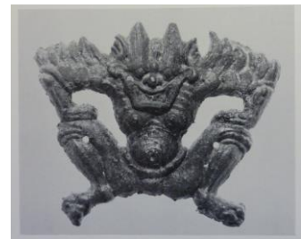
図11 羽人形金具 7.9 cm

本鏡を所蔵する久保惣記念美術館の『蔵鏡図録』では、富岡説をうけて描かれた図像の多く、例えば狻猊（獅子）や諸神が隋代まで受け継がれるとして時代を下げている 37 。しかし、むしろ晋代前後にその指摘のほとんどを見出すことの方が肝要である。例えば禪姿の力士については、羽人形金具として三国時代とする禪姿の怪神の浮彫があり（図11） 38 、また外縁の輪つなぎ文の鏡（唐草流雲文鏡）は、三国から六朝時代とするなど（図12） 39 、いずれも時代を遡上させている。