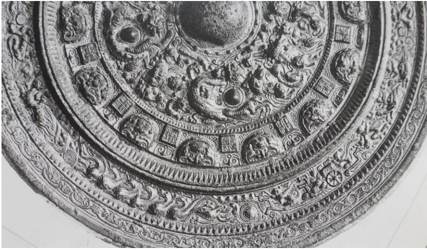
図6 建武五年鏡 画文帯1