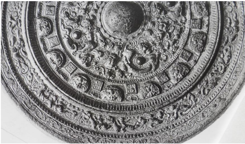
図7 建武五年鏡 画文帯2

外縁の文様は輪つなぎ文で、内側を唐草状に展開し上下に交錯する流雲文が巡り華やかな雰囲気を出している。その外に凸線が巡り無文の縁で終わっている。