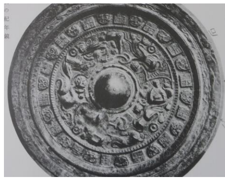
図 3 半円方形帯神獸鏡 西晋 273 年径 17.6 cm

後藤守一氏は高橋健自、富岡謙蔵両氏の説を紹介し、確実な資料が乏しくいずれも定説とはできないが、仮に（一時的に）富岡説に従うと記している 6 。