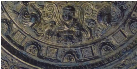
図10 画文帯四神四獸鏡 径14.2 cm