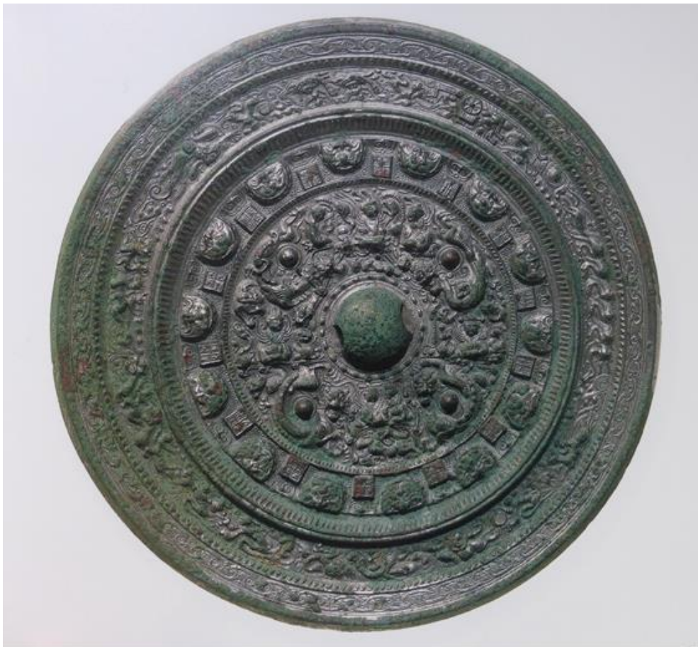
図1 建武五年鏡 径24.2 cm