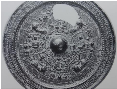
図 2 正始元年三角縁神獸鏡 径 22.7 cm

二年後、大正 6 年（1917）富岡謙蔵氏は、後趙は僻遠で文明が開けていず、このような技能がある土地とは考えられないとして、南齊建武 5 年の 498 年とした 5 。その理由としてこの鏡が現存の紀年銘鏡中最大であること、この神獸鏡の形式が精緻さを加えて永く後世に行われ隋唐に至ると考えたこと、その傍証に正始元年三角縁神獸鏡を魏の 240 年でなく宋の 465 年と見ていたことによる（図 2）。