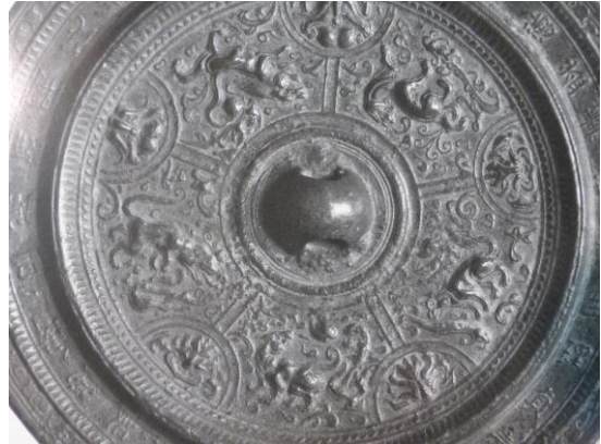
図9 五格五獸文鏡 隋-唐 径19.2 cm